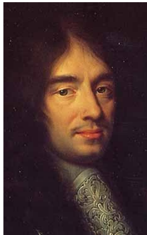
Charles Perrault, 1665

Pod koniec lat 60-tych Perrault stworzył kilka utworów okolicznościowych związanych z życiem dworu króla Ludwika XIV, zaś w 1674 roku opublikował rozprawę „Critique de l'Opéra” („ Krytyka opery ”) stanowiącą jeden z pierwszych głosów w tzw. Sporze Starożytników z Nowożytnikami – autor opowiedział się tu po stronie kultury współczesnej zwracającej się ku językom ojczystym, która jego zdaniem równała się jakościowo z kulturą antyczną. Po wstąpieniu do Akademii Francuskiej w 1671 roku kontynuował debatę ze zwolennikami klasycznych kanonów kultury, a swoje poglądy podsumował później w dziełach „ Wiek Ludwika Wielkiego ” (1687) oraz „ Porównania starożytnych z nowożytnymi ” (1688-97).